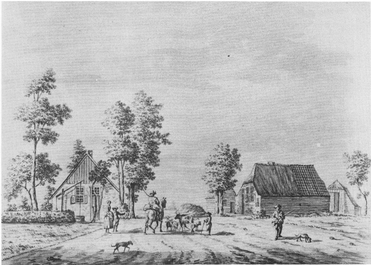
Fig. 4 De Vier Winden omstreeks 1780 met aan beide zijden van de weg van Putten naar Bijsteren gebouwen. Precies zoals ook te zien is 50 jaar later op de kadastrale kaart van 1832 in fig. 5.

de Vier Winden. In 1795 (GA 864-0044) verkoop van ...een schepel saaijland geleegeen bij het dorp Putten in den Eng, waaraan ten oosten en westen de Kellnarije van Putten, ten zijden de heer van Baak en ten noorden de Vier Winden.